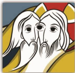
LETO BOŽJEGA USMILJENJA