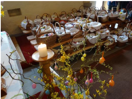
vsej župnijah zažarela v Jezusovi zmagi nad smrtjo.

V praznovanju svetega tridnevja Velike noči je sobota dan, ko je naš Gospod Jezus počival v grobu. Na ta dan se po vseh župnijah že v zgodnjih jutranjih urah blagoslavlja ogenj in čez dan verniki prinašajo k blagoslovu velikonočna jedila. Tako se je dogajalo tudi letos po celotni naši Pastoralni zvezi Dravograd. Veliko vernikov je prihajalo po blagoslovljeni ognju, da so z njim pokadili svoje domove in jih blagoslovili z izročitvijo v Božje varstvo. Na tem blagoslovljenem ognju se potem kot