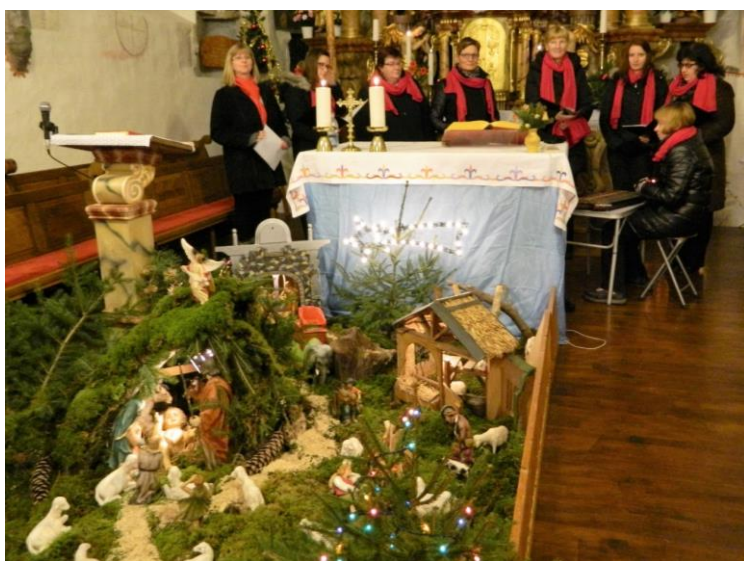
jaslice v Šentjanžu (nastop pred polnočnico)