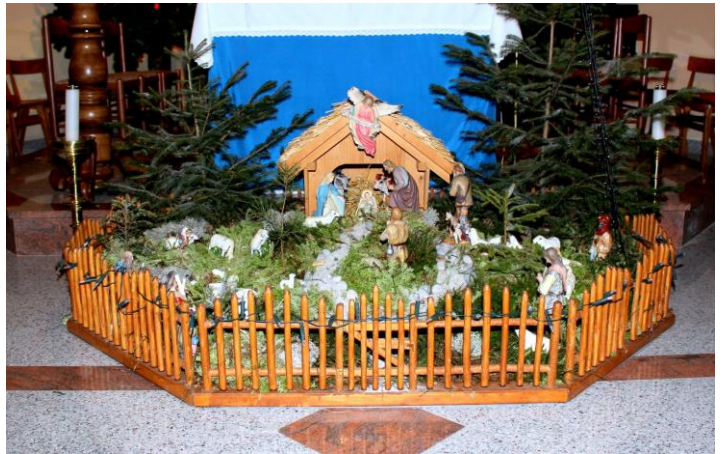
jaslice v Črnečah