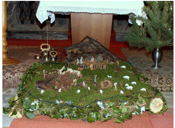
jaslice pri Sv. Križu