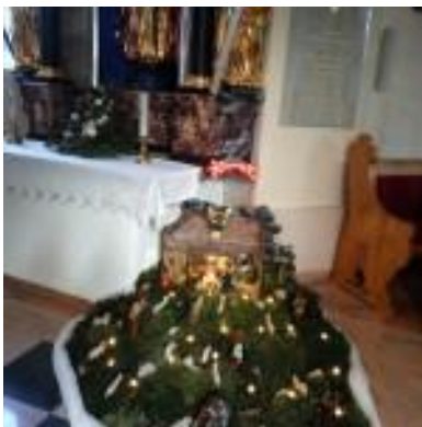
jaslice v Libeličah