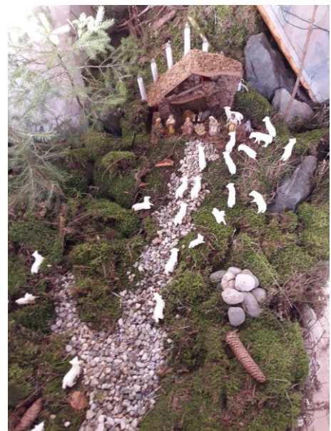
jaslice pri Sv. Magdaleni na Vratih