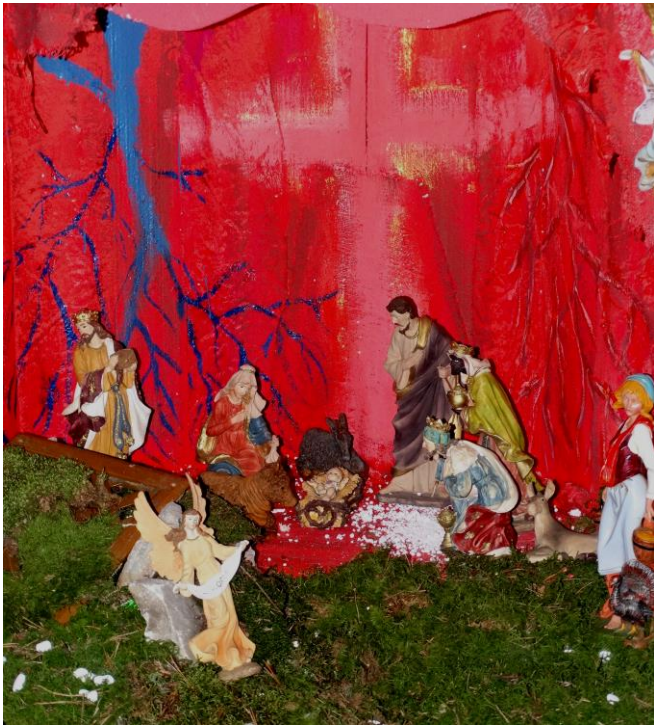
'Jaslice Srca' v Dravogradu