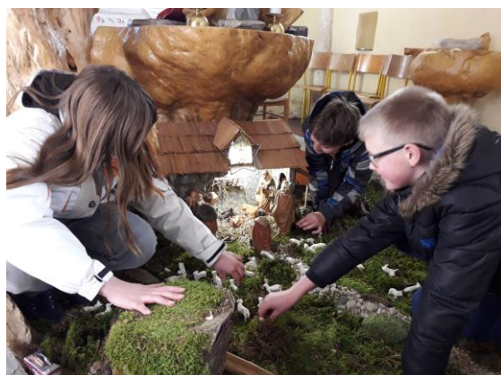
Postavljanje jaslíc z veroučenci na Ojstrici