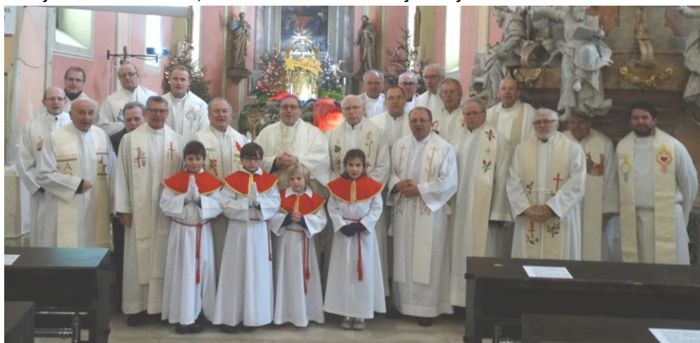
Ob začetku vizitacij v Koroškem naddekanatu – skupaj z nadškofom v Dravogradu 1.2.2017