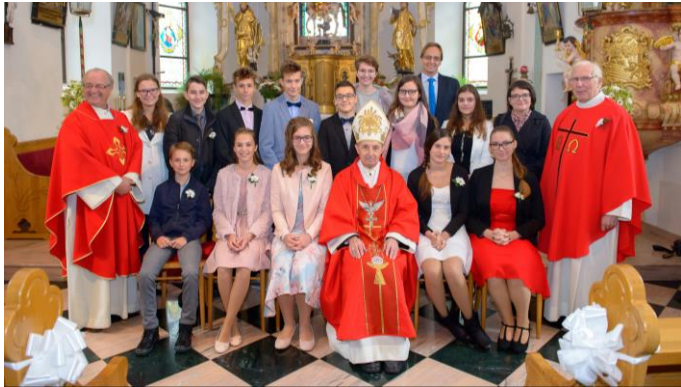
Birmanci v Libeličah 2018