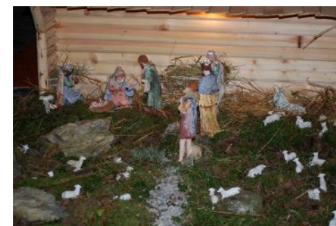
Jaslice na Ojstrici