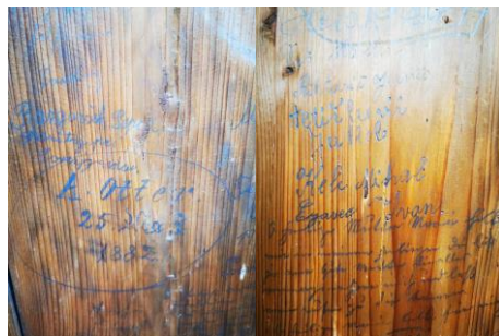
V kapeli je polno votivnih podob in zapisov. Znamenje hvaležnosti in vere naših prednikov.