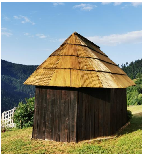
lepa streha iz šintlov čaka prvi dežek