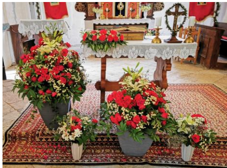
Cvetja je v obilju in čudoviti aranžmaji krasijo podružnično cerkev Sv.Lenarta

Vsem Bog povrni. Opoldanski čas pa je bil po maši namenjen druženju, ki ga je pripravilo Športno društvo Vič.