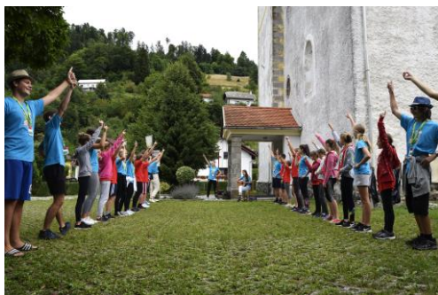
utrinek letošnjega oratorija v Dravogradu

Geslo tedna in nedelje mladih 2021 bo enako kot na Stični mladih: » Utrdi moje korake. « V naši PZD pa bomo v tem tednu mladih pričeli tudi veroučna srečanja za novo veroučno leto. Pričakujemo sodelovanje.