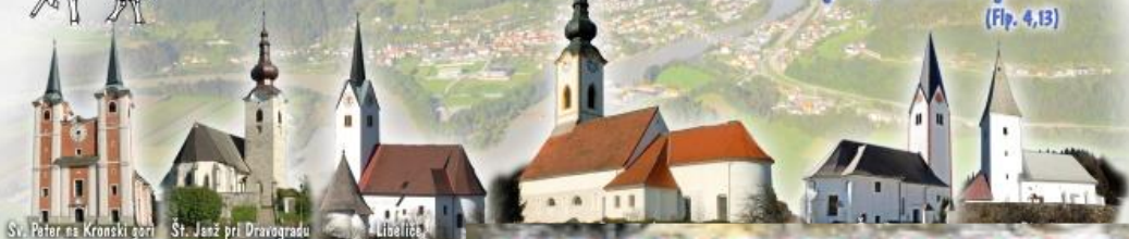
Sv. Peter na Kronski gori