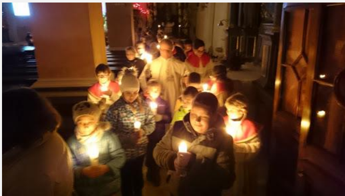
Procesija z svečami na svečnico

Običaj blagoslova sveč na svečnico je povezan s Simeonovo napovedjo, da bo Jezus prinesel luč in odrešenje svetu.