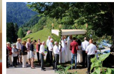
Velika množica ljudi je spremljala slovesnost.