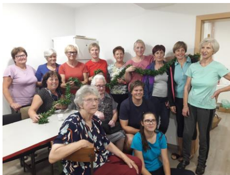
Domačinke so napletle lepe vence