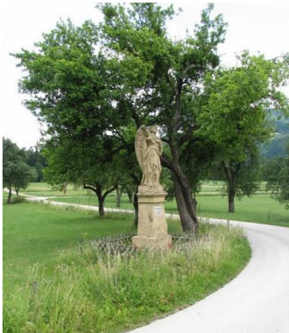
(kip angela na Dobrovi)

Obstoj angelov si je treba razlagati podobno kakor obstoj ljudi: razlog za njihovo bivanje je Božja ljubezen; Bog, ki je sam v sebi neskončno srečen, hoče stvari narediti deležne svoje popolnosti in svoje notranje sreče. V bogoslužju je v četrti evharistični molitvi v hvalospevu Očeta lepo rečeno: »Samo ti si dober, ti si vir življenja. Zato si vse ustvaril, da bi