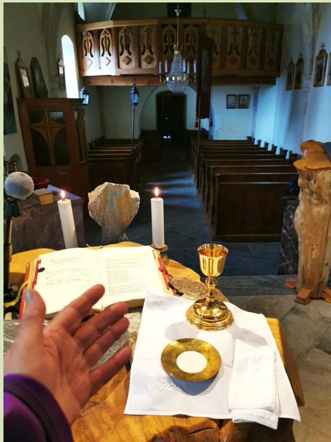
pogled na prazno cerkev med sveto mašo na Ojstrici v času razglašene epidemije

Nekega dne je stari škof v Miri umrl. Kristjani v mestu so bili zelo žalostni. »Kdo bo zdaj naš škof?« so spraševali drug drugega? Niso poznali nikogar, da bi nasledil umrlega škofa. »Bog nam mora dati znamenje,« so dejali. Naslednjo noč je škofov svetovalec slišal v sanjah glas: »Postavi se naslednje jutro zgodaj pred cerkvena vrata in dobro pazi. Prvi mož, ki bo prišel k sveti maši in mu je ime Miklavž, naj bo vaš škof.« Svetovalec je svoje sanje zaupal kristjanom. Komaj je vzšlo sonce, je hotel Miklavž v cerkev, da bi molil. Ko je Miklavž odprl težka