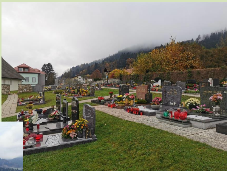
Grobovi v Šentjanžu

Samevalo je tudi pokopališče na Šempetru.