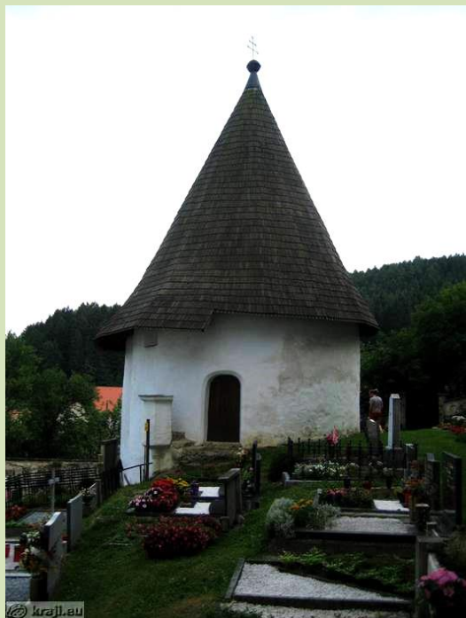
grobovi v Libeličah s kostnico

Naši letošnji Vsi sveti so ostali povsem v prepovedi vseh maš z ljudstvom. Tako so bili grobovi tudi letos lepo urejeni, žal pa maš in molitve na grobovih ni bilo.