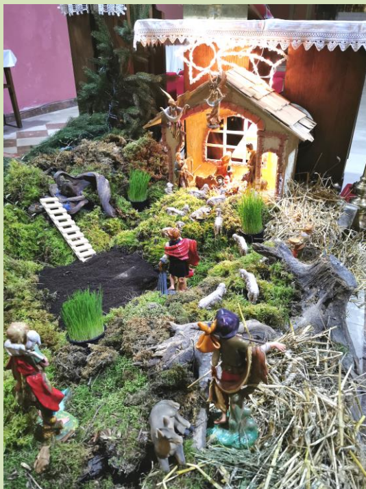
(levo) Dravograjske jaslice 2020

Tedaj bo Jezus zopet prišel na svet, da nas bo sodil in z vso pravico, ker je trpel, umrl in vstal za nas. To vedno ponavljamo v molitvi Vera, kadar pravimo "in bo spet prišel v slavi sodit žive in mrtve." Pomislimo na to temeljno versko resnico.