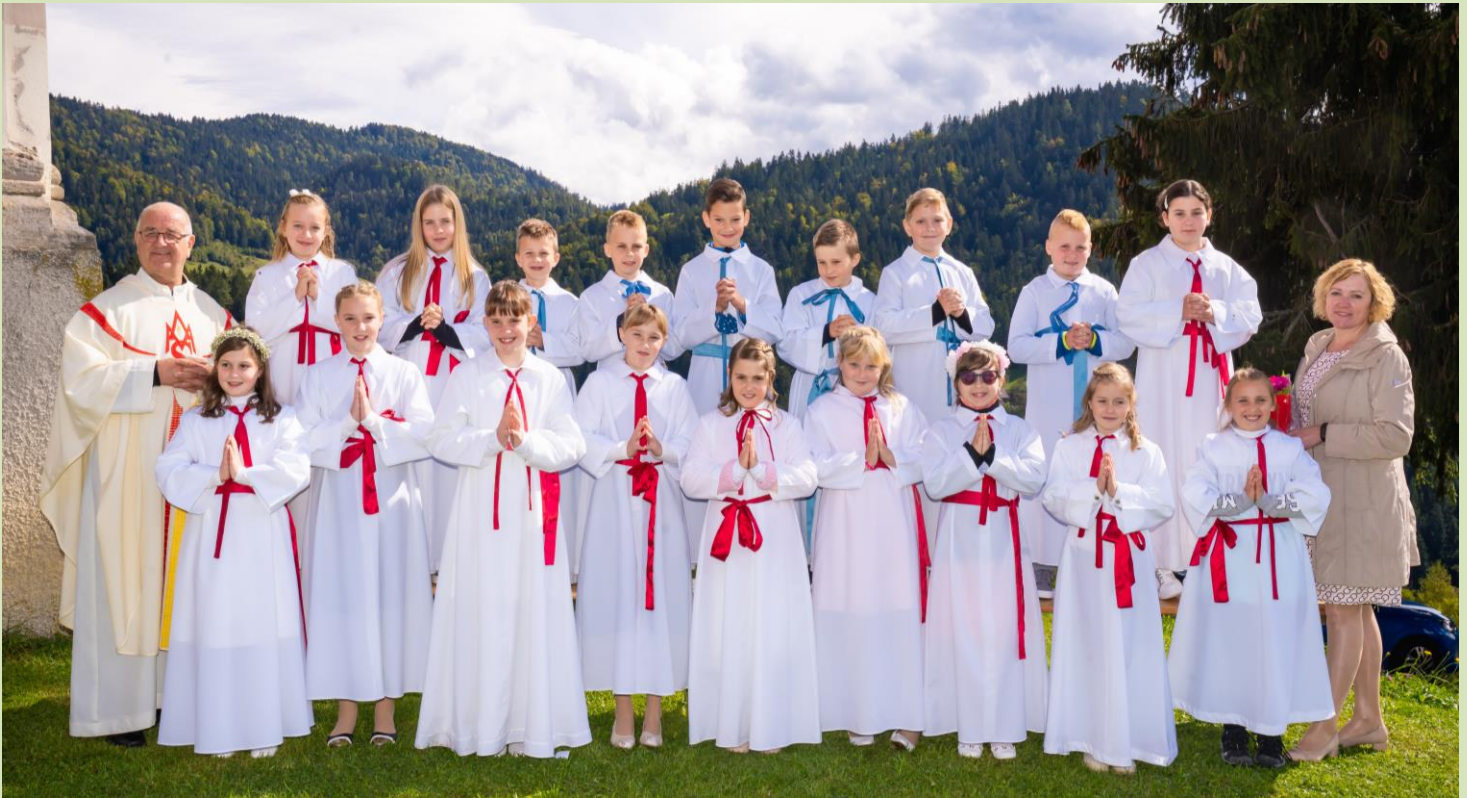
Skupinska fotografija prvoobhajancev 2020 iz župnij Šempeter in Šentjanž.