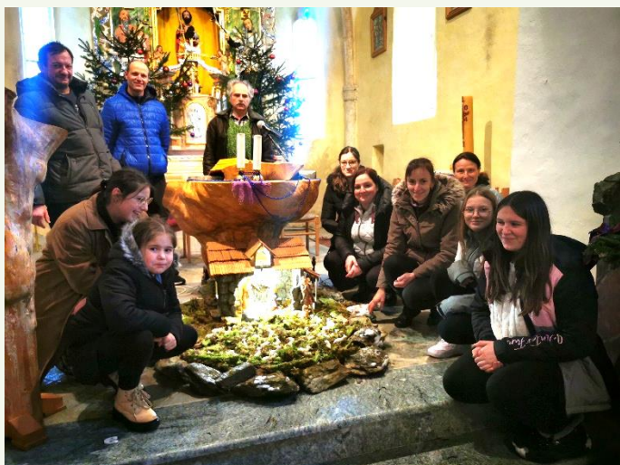
Postavljanje jaslíc na Ojstrici