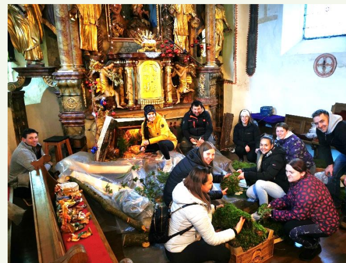
Starši in otroci prvoobhajanci pri postavljanju jaslíc v Šentjanžu