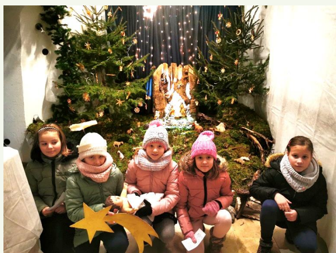
Jaslíc v Dravogradu – igralke božičnega prizora