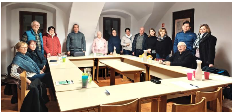
Zadnja seja dosedanjih ŽPS iz naših župnij PED.