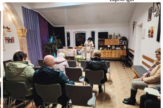
Mini svetopisemski maraton