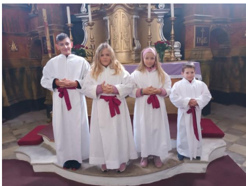
'novi' ministranti v župniji Šempeter – slovesen sprejem na Tiho nedeljo 2023

Po: Youcat – Molitvenik za mlade, Prim. Ps 91