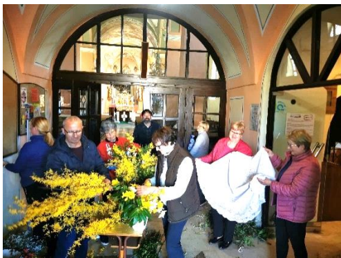
Skupina krasilk v Dravogradu pripravlja božji grob in okrasitev za Veliko noč.