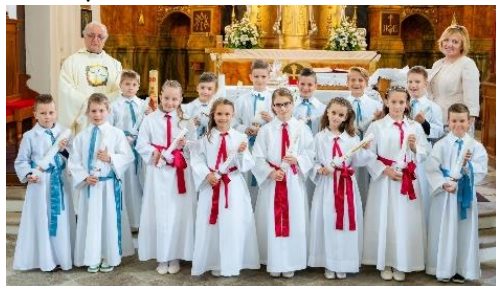
Prvoobhajanci na Šempetru

Temeljita je tudi priprava na to srečanje. Tako smo tudi letos skrbno pripravljali otroke na ta velik dogodek. Tako v Libeličah, Črnečah, Šentjanžu in v Dravogradu so potekala resna in odgovorna srečanja naših otrok na ta velik in pomenljiv dogodek. Tudi priprava na prvo sveto spoved je bila temeljita. Spoved so opravili v Šentjanžu in v Dravogradu kar dvakrat pred praznovanjem prvega obhajila.