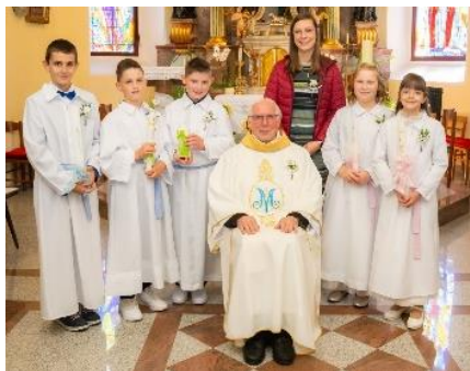
Prvoobhajanci v Črnečah

je poseben trenutek v življenju prvoobhajancev. Ob prvem svetem obhajilu nas Jezus sprejme v svoje srce. Od prejema tega zakramenta se lahko kristjan kadar koli želi udeleži svetega obhajila in tako prejme živega Boga. Pri sveti evharistiji se namreč kruh – hostija spremeni v Jezusovo telo, vino pa v njegovo kri.