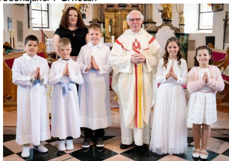
Prvoobhajanci v Libeličah