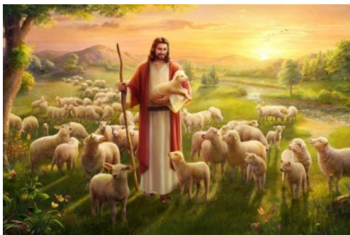
Jezus dobri pastir – duhovniki dekanije Dravograd -Mežiška dolina

Tako bi njihovo življenje bilo kar najbolj podobno Jezusovemu. Postali bi dar za druge.