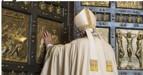
Slovesno odpiranje vrat bazilike Sv.Petra v Rimu

ampak je potrebno tudi naše sodelovanje. In hkrati pravi to upanje. Papež uporablja zanimiv izraz: ni to lahkomišelnost upanje, ampak gre za eno drugo vsebino. Tam je naše upanje: na koncu; ta pogled s konca: v Kristusu.«