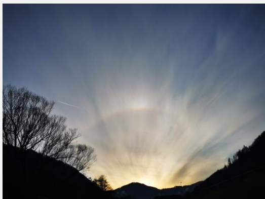
pogled od Špara na zahodno nebo- 4.2.2021 (Igor)

Youcat - Molitvenik za mlade, Mati Terezija